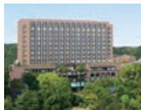
リーガロイヤルホテル東京 [東京・早稲田] ● TEL(03)5285-1121