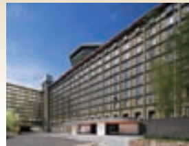
リーガロイヤルホテル京都 [京都・京都駅西側] ● TEL(075)341-1121