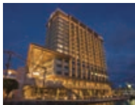
リーガロイヤルホテル那覇 [沖縄・那覇] ● TEL(098)867-3331