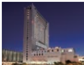
リーガロイヤルホテル小倉 [福岡・小倉駅前] ● TEL(093)531-1121