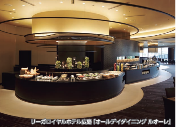
リーガロイヤルホテル広島「オールデイダイニング ルオーレ」