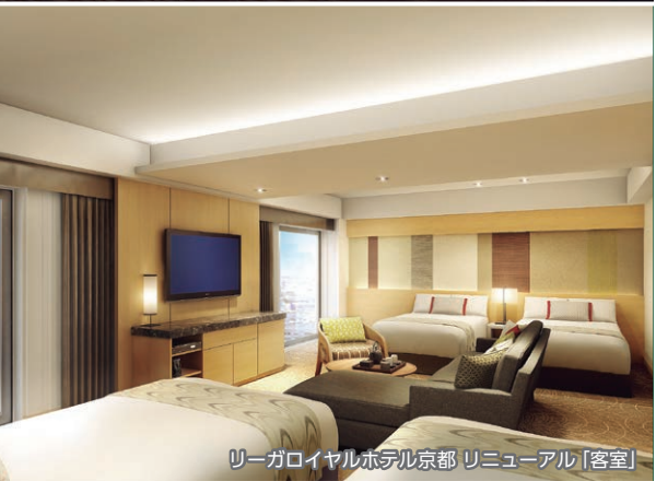
リーガロイヤルホテル京都 リニューアル「客室」