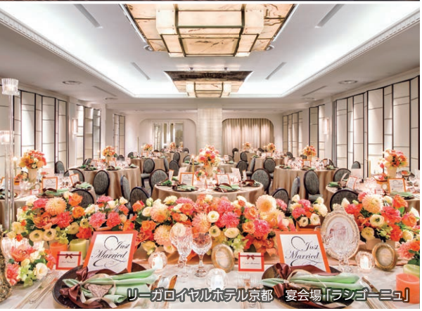
リーガロイヤルホテル京都 宴会場「ラシゴニコ」