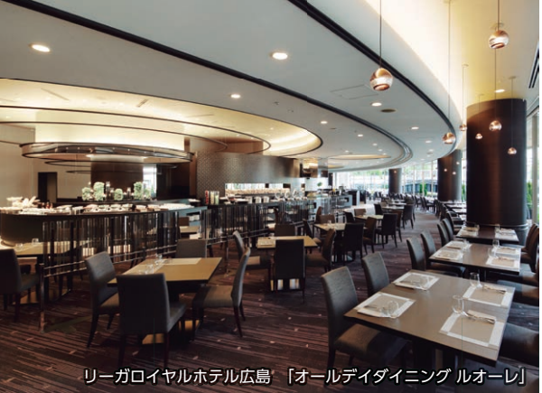
リーガロイヤルホテル広島 「オールデイダイニング ルオーレ」